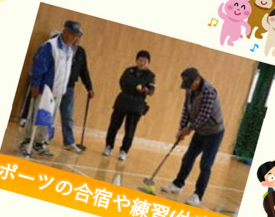
スポーツの合宿や練習(体育館)