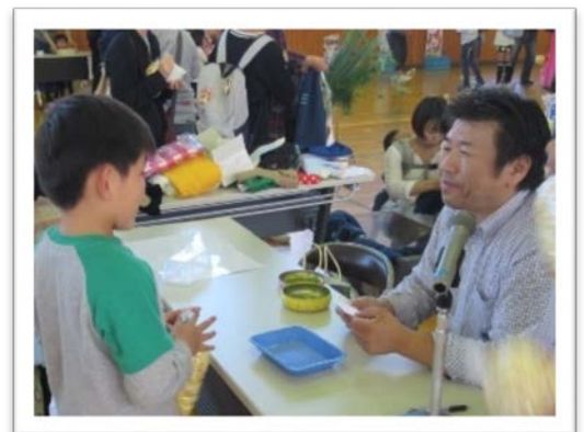
【何気ない言葉が子どもを育みます】

「ありがとう」「助かるよ」「すごいね」などの肯定的な言語環境を、学校、家庭、地域が整え、子どもの進級・進学をお祝いしたいものですね。